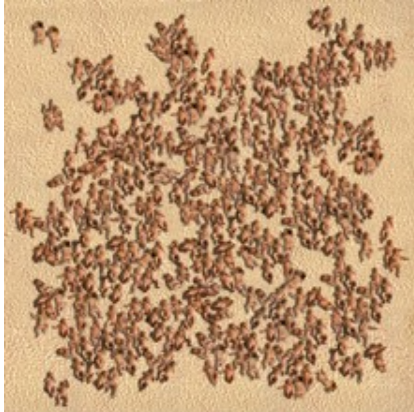
En un jardín artificial 2

2001 fotografía 120 x 120 cm Cibatrans en caja de luz