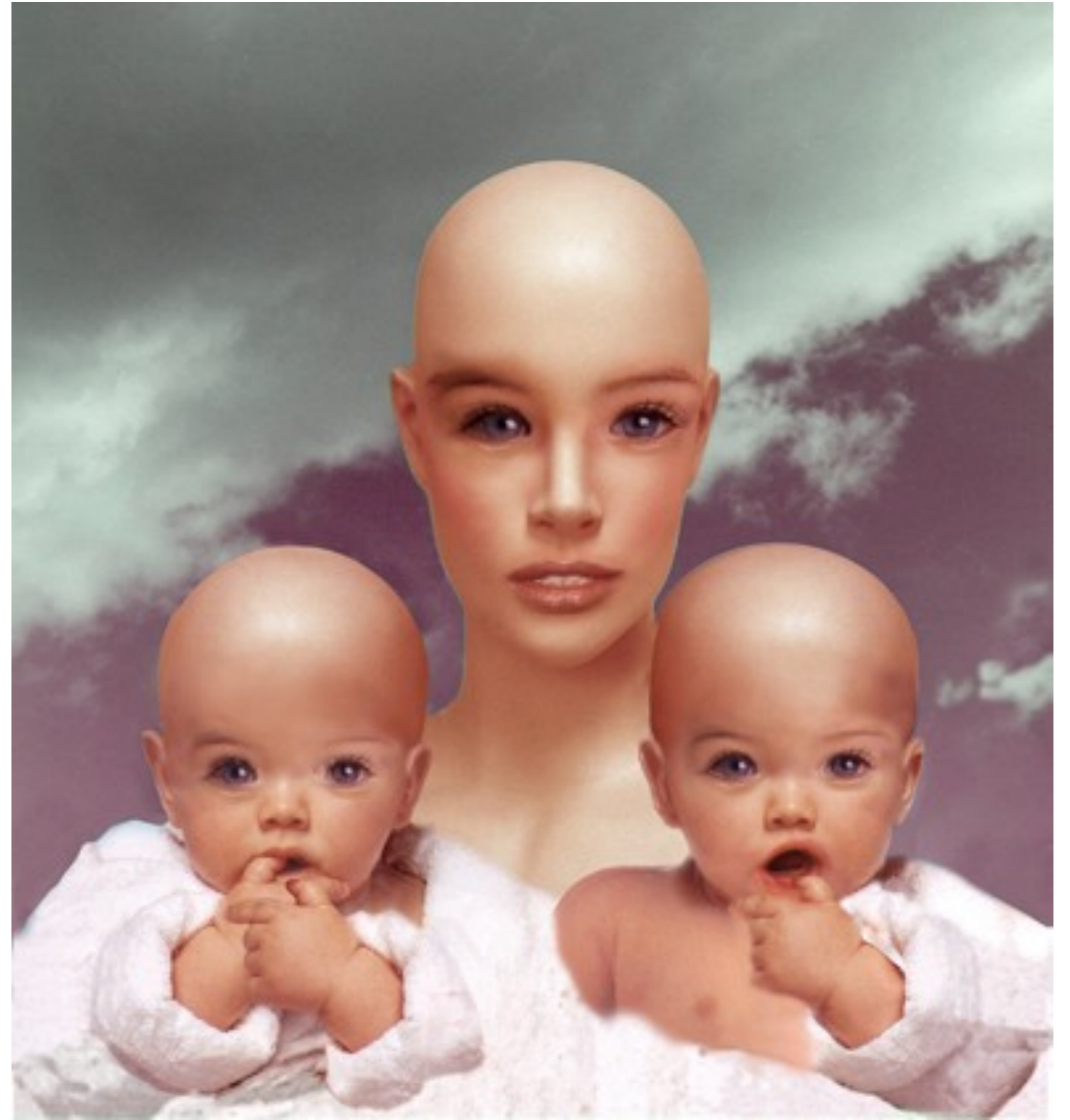
2000 fotografía 70 x 65 cm Cibatrans doble imagen (flip), caja de luz