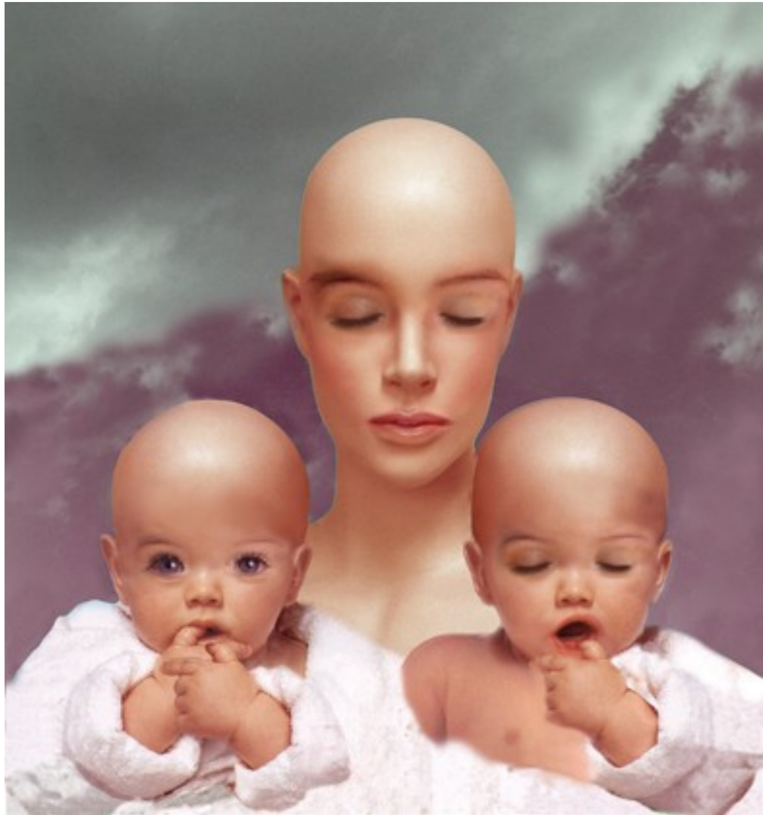
De un jardín artificial 2