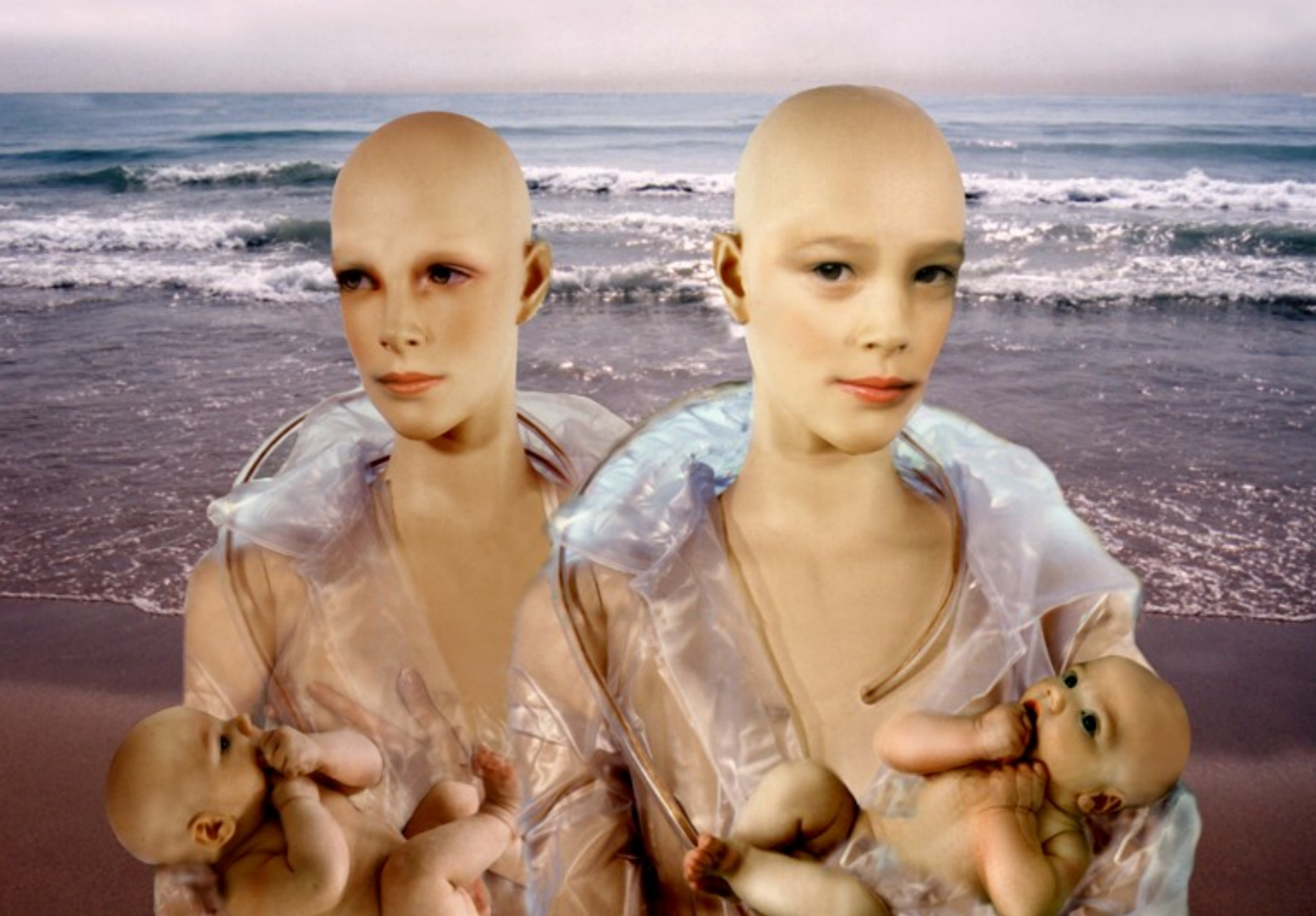
Maternidad 3 2000 fotografía Cibachrome metacrilato