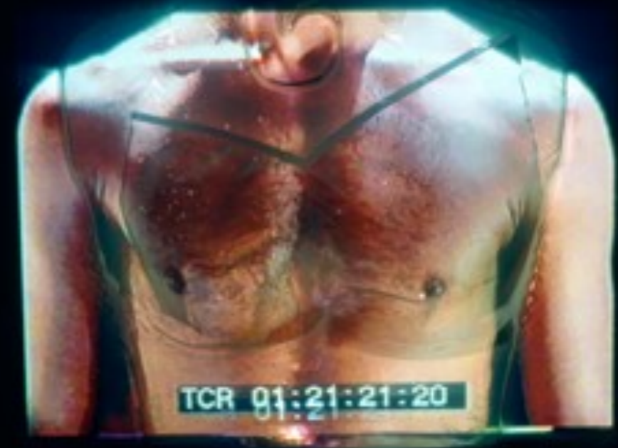
De la casa del olvido o de la dualidad del ser

1997 vídeoescultura sonora 35 x 50 x 12 cm vídeo digital molde de plástico (busto femenino) urna de metacrilato