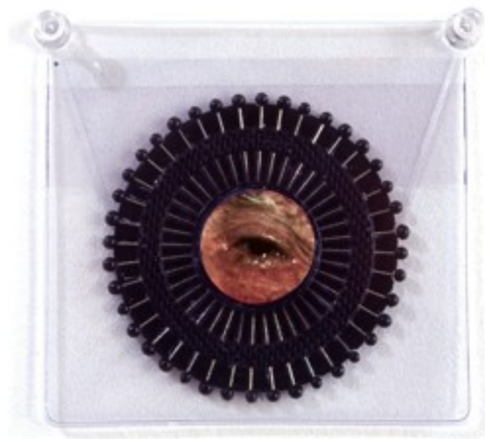
Alfileres de cabeza negra

1997 objeto 20 x 9 x 20 cm bolso de plástico 33 saleros con 33 ojos de plástico