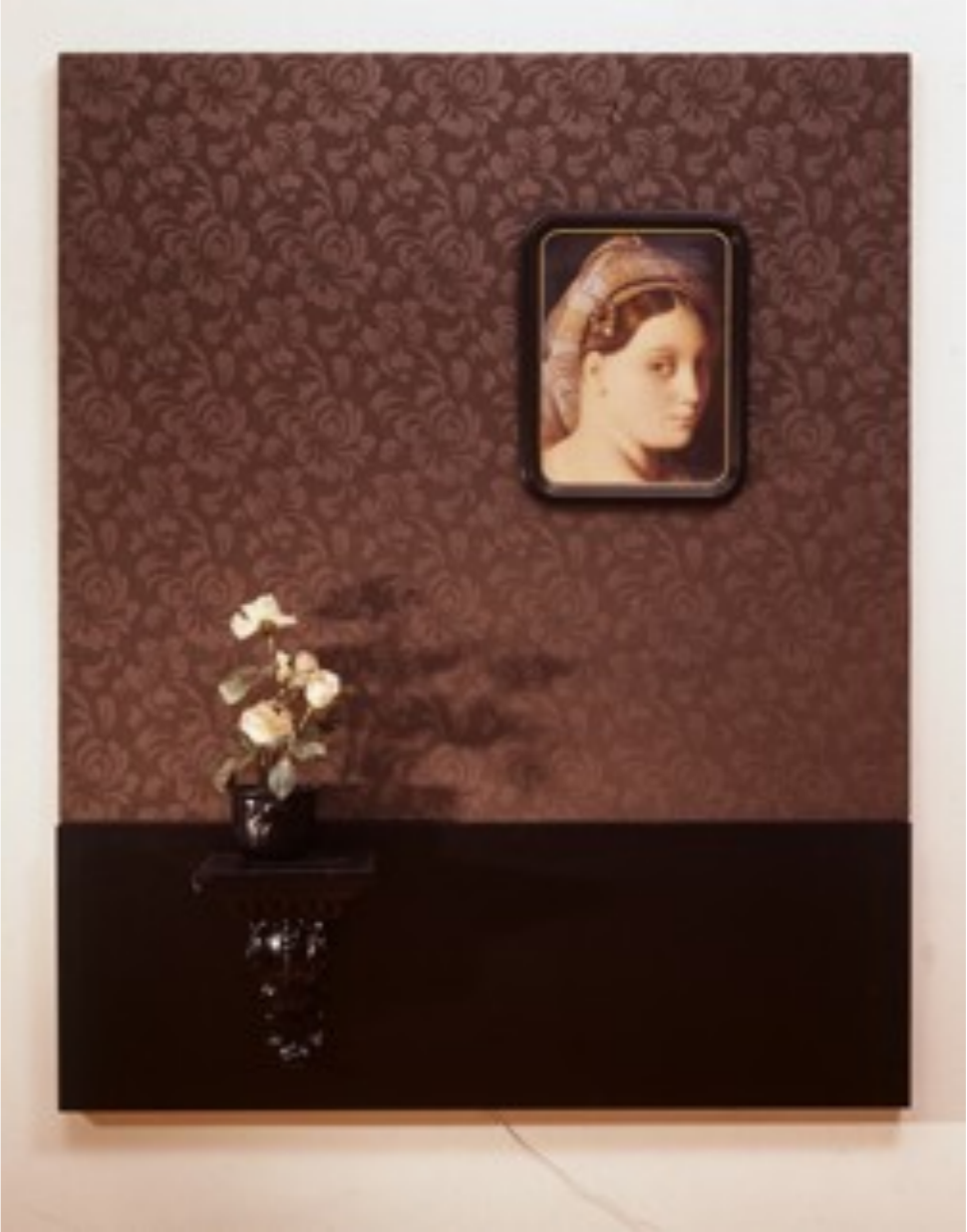
Roses pour l'Odalisque