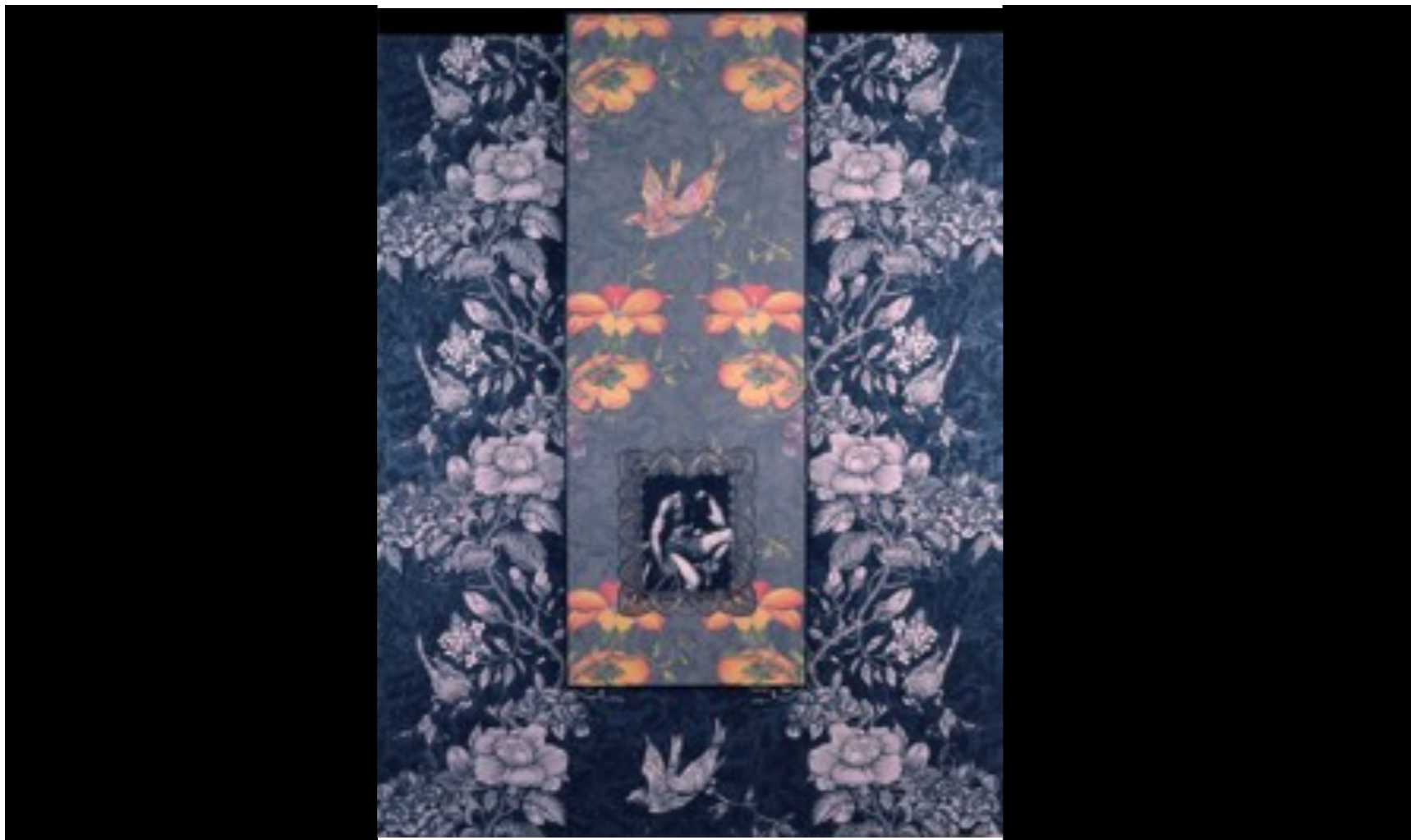
1989 ensamblaje 180 x 304 cm melaminas negras telas, fotocopia blonda plateada enmarcaje en aluminio negro y plástico