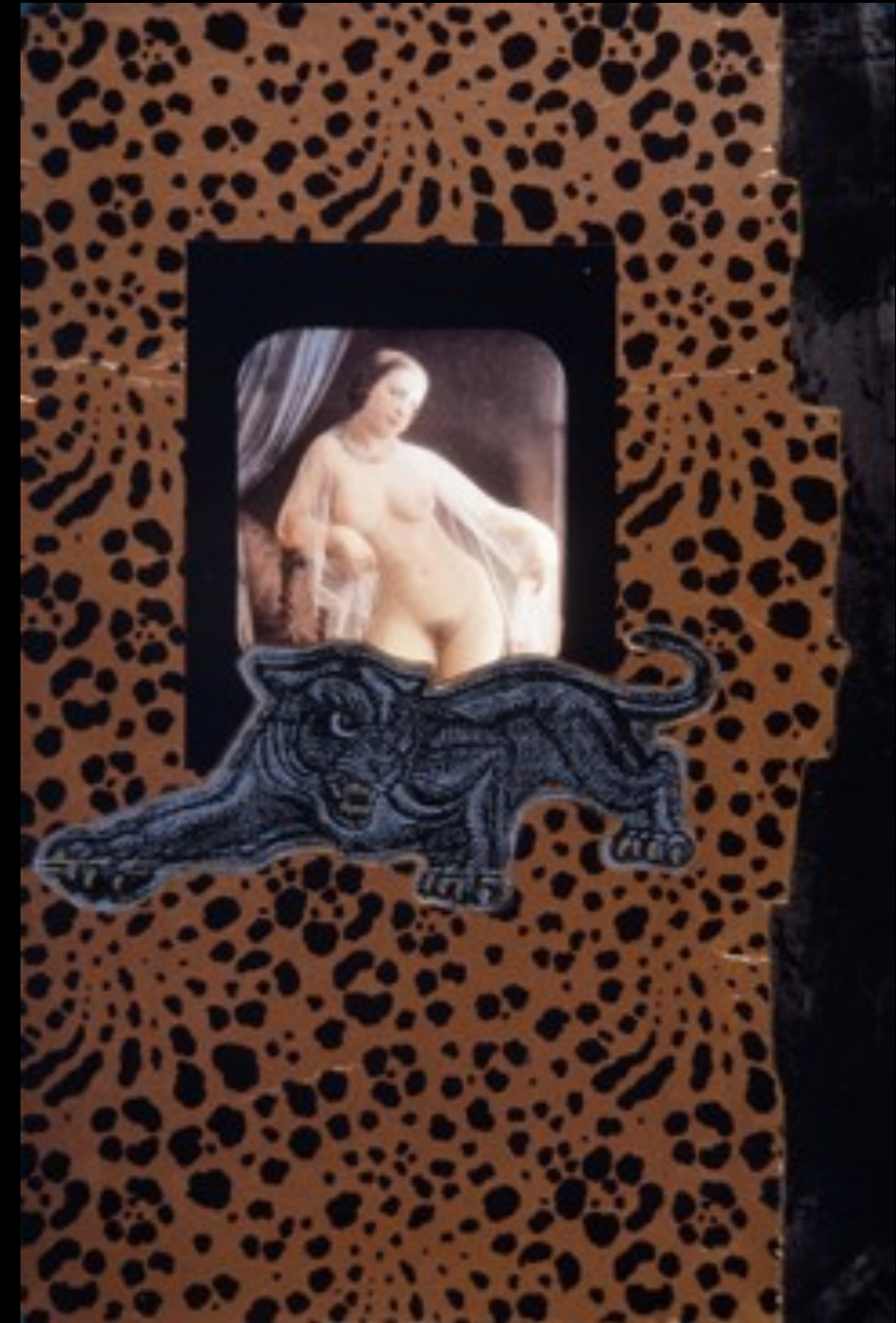
Casa de citas