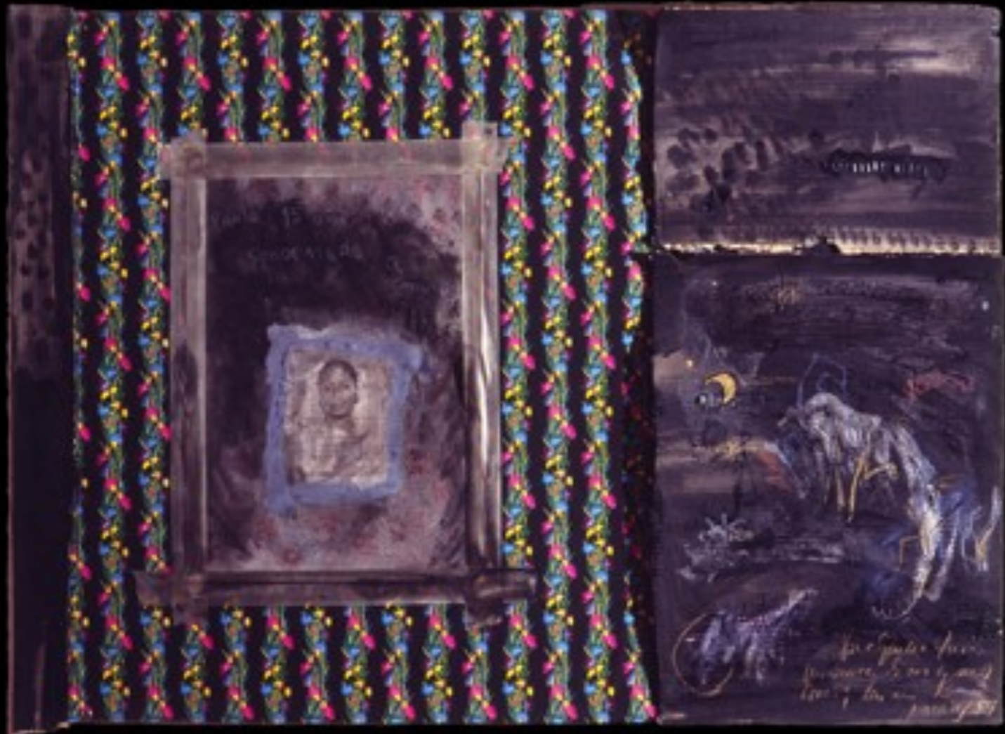
Pena de muerte