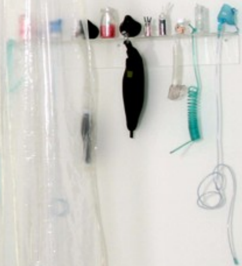
Milena, del corazón y el artificio