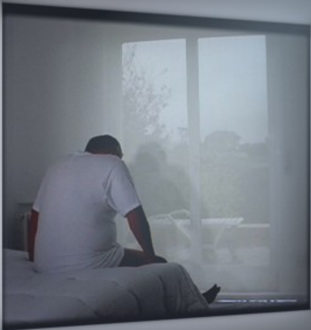
Stand by. Habitaciones. Habitación 42

2002 vídeo instalación sonora Sala gris 400 x 160 x 500 cm proyectores de DVD, cortinas de plástico