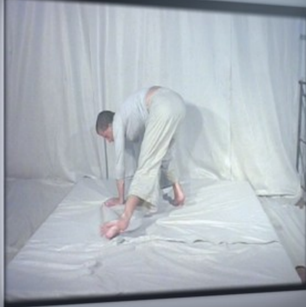
Stand by. Habitaciones. Habitación 4

2002 vídeo instalación sonora Sala gris 400 x 160 x 500 cm proyectores de DVD, cortinas de plástico