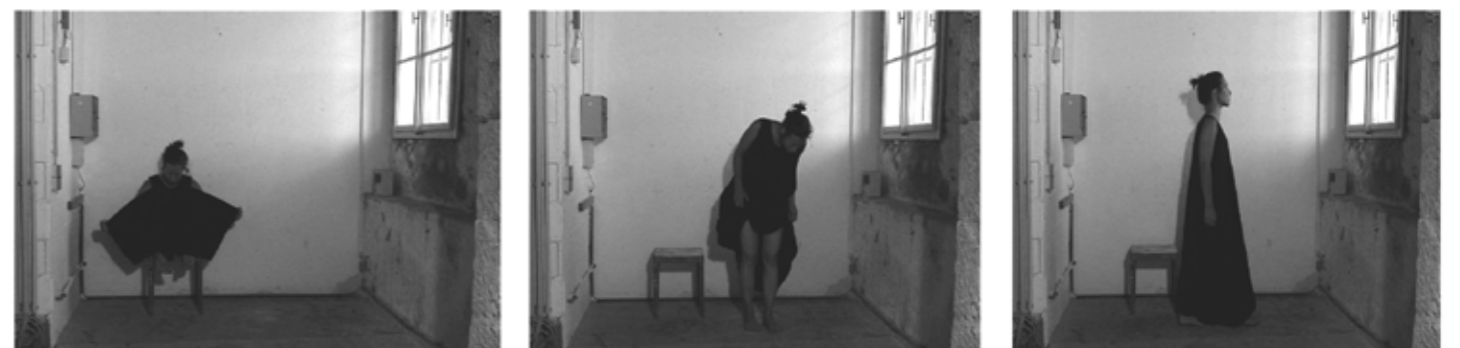
2002 vídeo digital 2002 vídeo digital 2002 vídeo digital 2002 vídeo digital