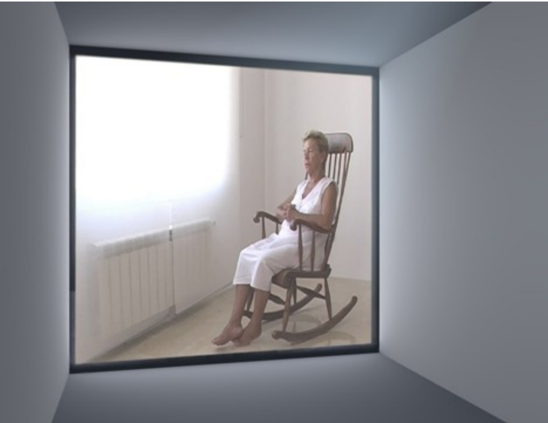
2002 vídeo instalación sonora Sala gris 400 x 160 x 500 cm proyectores de DVD, cortinas de plástico