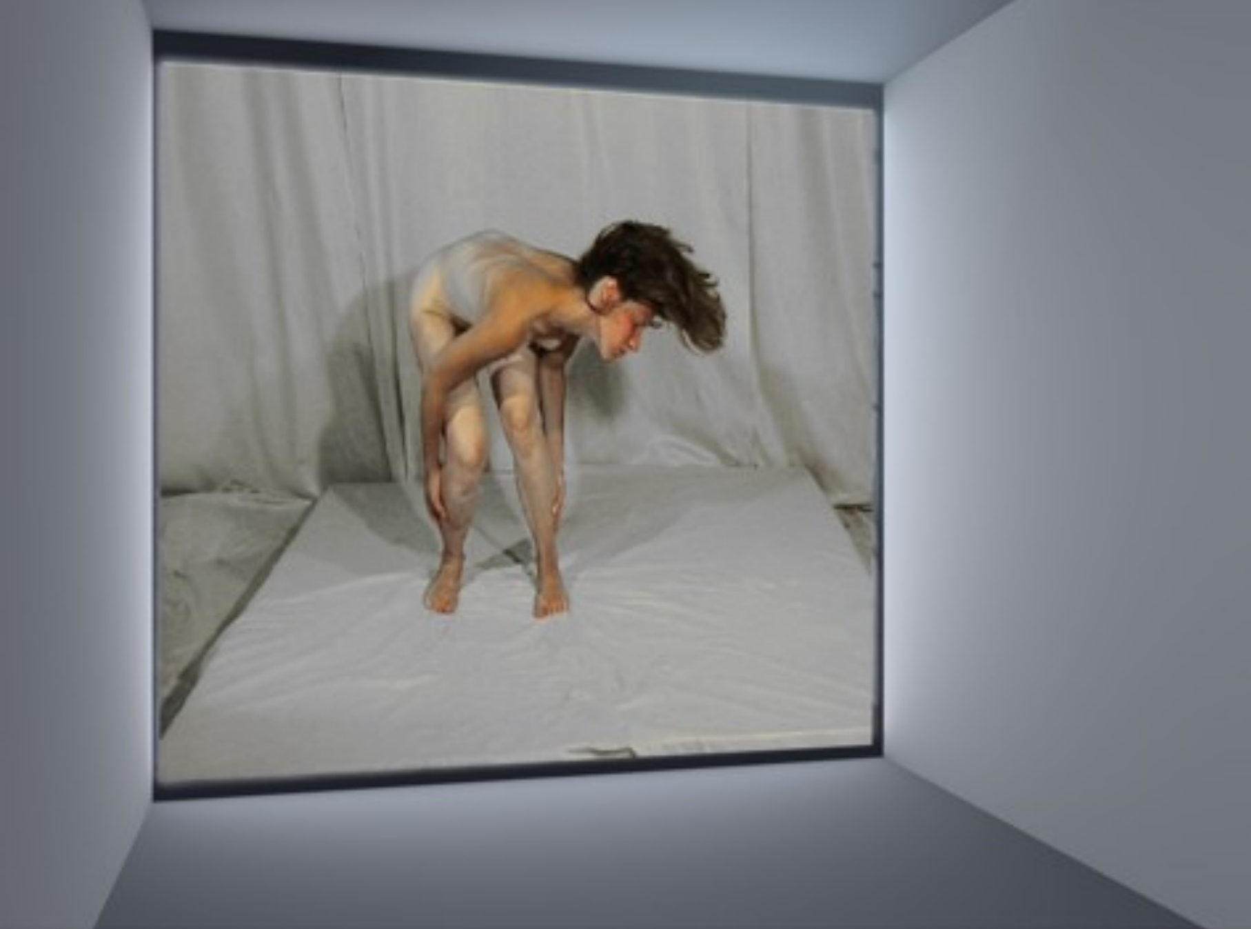
Habitación 8 Habitación 13 Habitación 42 Habitación 19